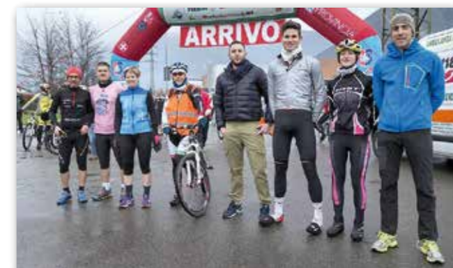
Testimonial e parte degli organizzatori delle Salite del VCO

eventi legati a questa speciale raccolta fondi. Nonostante le avverse condizioni climatiche, si sono così svolte una gara in bicicletta (caratterizzata da un percorso di 45 chilometri nel medio VCO), una in mountain bike (di 25 chilometri nel Parco naturale di Fondotoce) e una corsa a piedi (di 9 chilometri fra le Cupole bianche e lungo le sponde del Toce). Alle varie competizioni hanno complessivamente partecipato duecento persone (uomini, donne e ragazzi) che hanno contribuito a raggiungere la somma di 2.210 euro da destinare alla preziosa ricerca scientifica di Telethon. Siamo quindi grati all'organizzazione e a tutti i volontari che hanno realizzato e curato queste iniziative (per ulteriori informazioni è possibile visitare il sito < http://www.salitedelvco.it/ >).