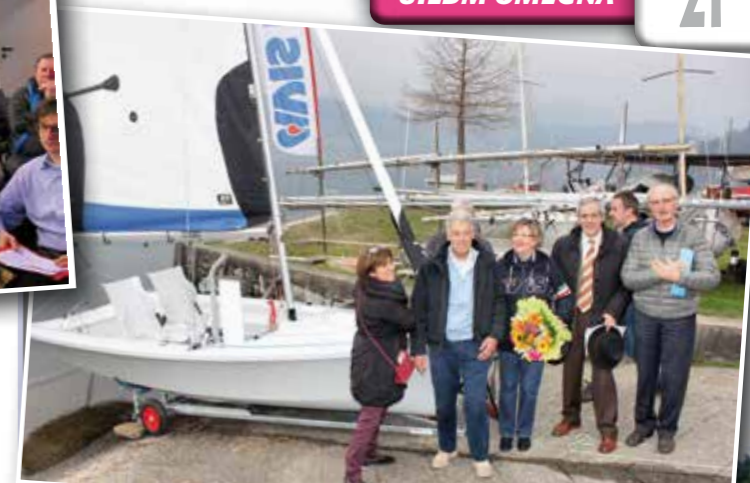
Il varo del Gian-Li 1

Presso la base nautica del Circolo Vela Orta, a Imolo, sabato 21 marzo è stata varata la prima barca a vela per disabili del lago d'Orta. È stato il coronamento di un progetto, denominato "Vela no limits", ideato e portato avanti dal suddetto Circolo e dalla