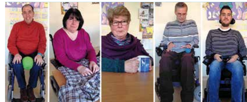
▼ Foto ricordo dopo l'intervista in Sezione da parte del settimanale "La Voce del Popolo"