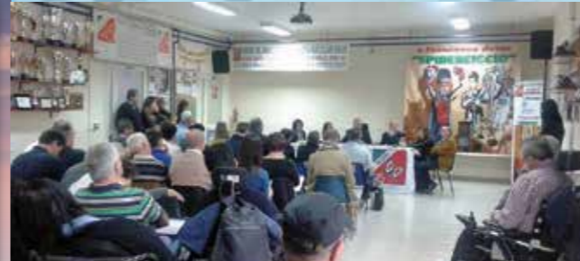
▲ Il Consiglio nazionale Uildm del 15 novembre scorso ad Arzano (NA)