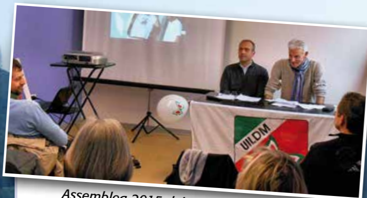
Assemblea 2015 dei soci: i relatori...

sono rientrati al punto di partenza, presso cui hanno potuto gustare un succulento ristoro preparato proprio dai volontari della Uildm.