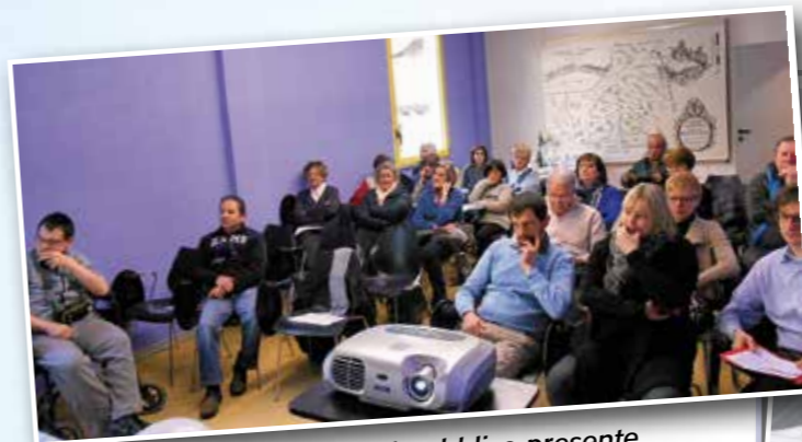
...e parte del pubblico presente

Nel 2014 si sono iscritti 162 soci (contro i 135