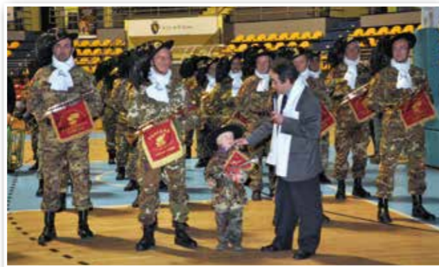
Il presidente della Uildm torinese col bersagliere... più piccolo!

PalaRuffini le più importanti bande militari italiane, radunate dall'associazione non profit Italian Military Tattoo. In un turbinio di note, melodie e marce, gli spettatori hanno accompagnato gli oltre duecento militari-musicisti fischiettando e canticchiando i vari brani eseguiti, che da tempo sono entrati nella vita di tutti noi: dalle canzoni