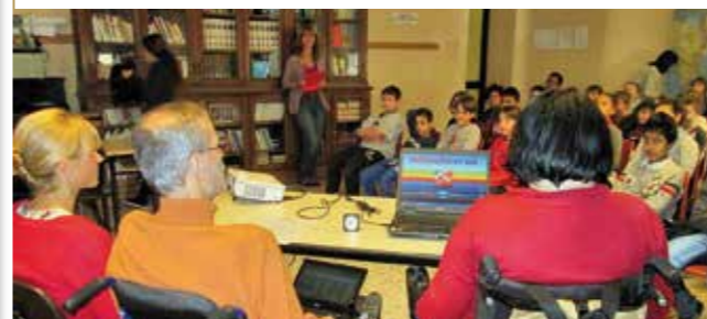
▲ Alla scuola elementare Fontana col progetto di sensibilizzazione "Abbasso le barriere!"