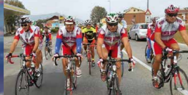
▲ Il "XXXIII Raduno ciclistico piemontese" targato Cicli Bergamin e Veloclub Frejus