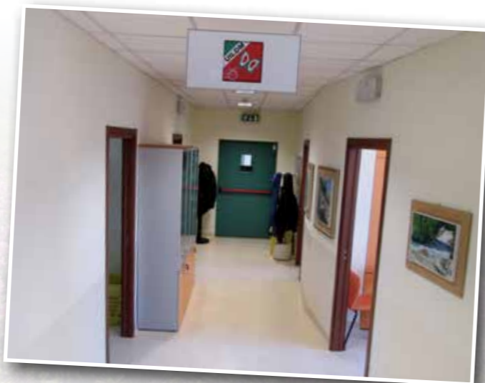
Via Cimabue n. 2

A questo punto, non sentite anche voi il desiderio di venire in via Cimabue ad osservare più da vicino questo divertente guazzabuglio?