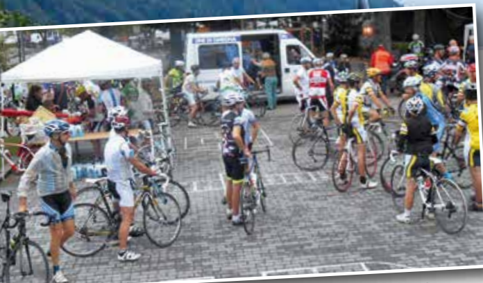
Partenza della "Pedalata per l'amicizia"...