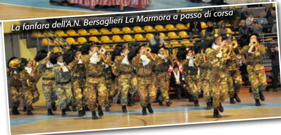
La fanfara dell'A.N. Bersaglieri La Marmora a passo di corsa