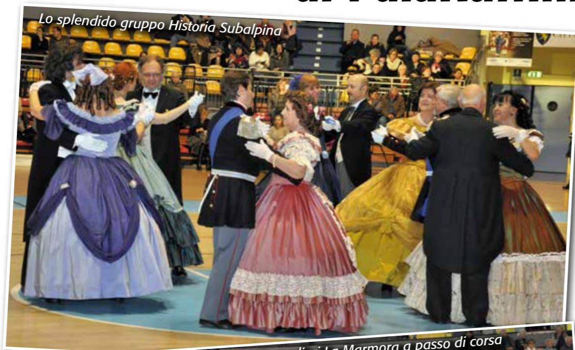
Lo splendido gruppo Historia Subalpina