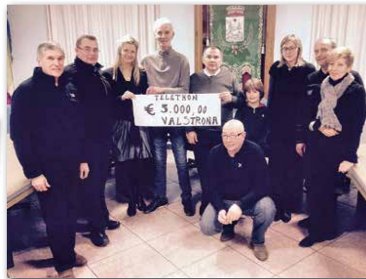
La generosità della Valle Strona